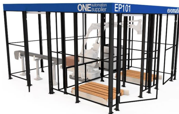
VY FRÅN SIDAN

EP101 är en helt fristående robotcell som med hög precision och takt plockar varierande material från inbana till pall. Utrustningen har även mellanläggshantering. Grunden är en standardutrustning men med goda möjligheter till kundanpassning efter specifika produkter och krävande behov.